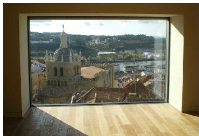
MNMC- Vista do interior

Esta zona do Museu é um dos pontos altos da visita. À qualidade excepcional das colecções aliam-se os valores do novo espaço arquitectónico que a luz indirecta do sol sublinha ou transfigura, ao longo do dia. Aliás, a arquitectura de G. Byrne, feita de rigor e silêncio, é repousante mas vívida, exactamente pelo uso criativo das aberturas voltadas ao exterior ou que ligam espaços internos. Para lá do efeito de surpresa,