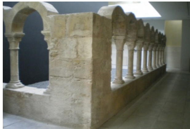
MNMC – Vista interior