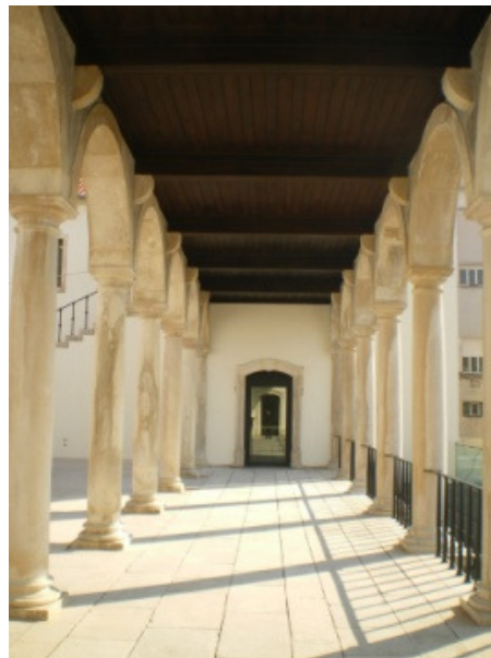
MNMC – Loggia renascentista

Aqui se foram sucedendo as ocupações até que, no séc. XII, o bispado se tornou proprietário de todo o espaço, para ampliação da sua residência e da igreja de S. João que lhe estava anexa. A praça ou pátio central constitui um exemplo impressionante de sobrevivência da carga simbólica de um lugar – foi centro administrativo, político e religioso na época romana, templo cristão pelo menos desde o séc. XI, paço episcopal a partir da segunda metade do séc. XII e museu desde 1911. Ao longo das oito centúrias que se seguiram, o paço, o espaço circundante e o próprio criptopórtico conheceram inúmeras alterações que fazem deste conjunto um dos lugares mais complexos e aliciantes da cidade.