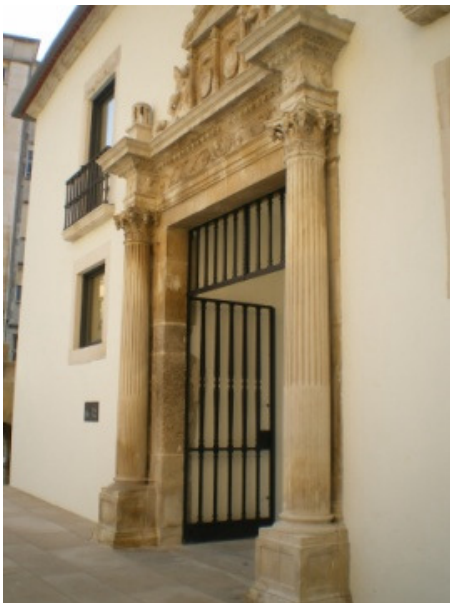
MNMC – Portal de Entrada

Trata-se de um lugar fundacional, pois nele se ergueu, há dois mil anos, o fórum de Aeminium, no cruzamento dos dois eixos principais da urbe romana, os quais ainda hoje constituem importantes vias da ligação entre a Baixa e a Alta coimbrás. Findo o Império, caiu o fórum em desuso e sobreveio a ruína. Manteve-se, no entanto, o seu embasamento, um portentoso criptopórtico claudiano, de dois pisos, formando sólido patamar ancorado a meia encosta. Este criptopórtico é o edifício de arquitectura civil romana mais importante e bem conservado no território português e um dos mais importantes criptopórticos da Europa.